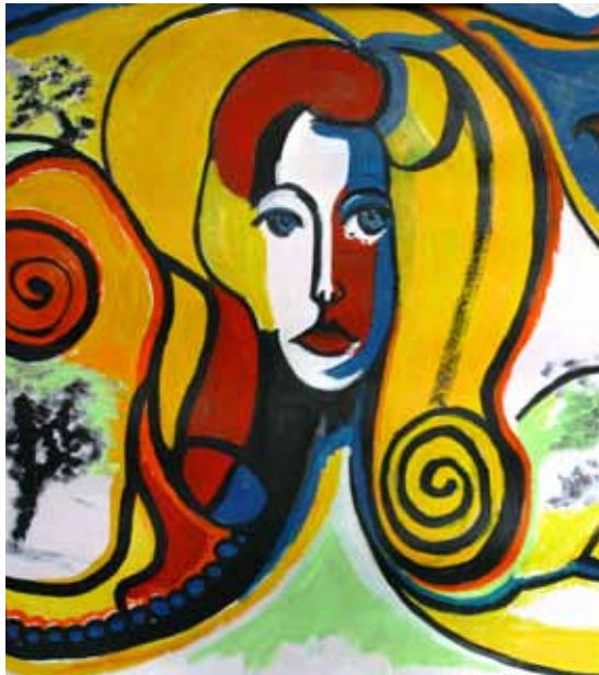
OBRA COLECTIVA DEL TALLER DE PLÁSTICA DEL FRENTE DE ARTISTAS DEL BORDO

"Las personas con enfermedades mentales pueden producirse daño a sí mismas u ocasionarlo a otras personas por lo tanto es necesario que sean tratadas por fuerzas de seguridad"