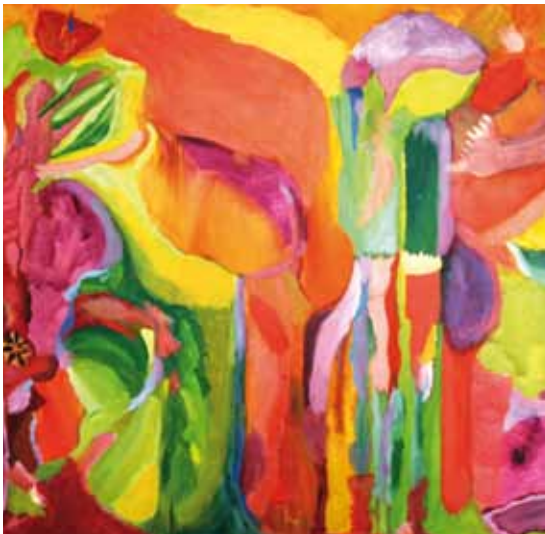
TORRES. PINTURA ELABORADA EN EL MARCO DE LOS TALLERES DEL FRENTE DE ARTISTAS DEL BORDA

“Les cuesta hacer deportes porque les cuesta seguir la consigna”