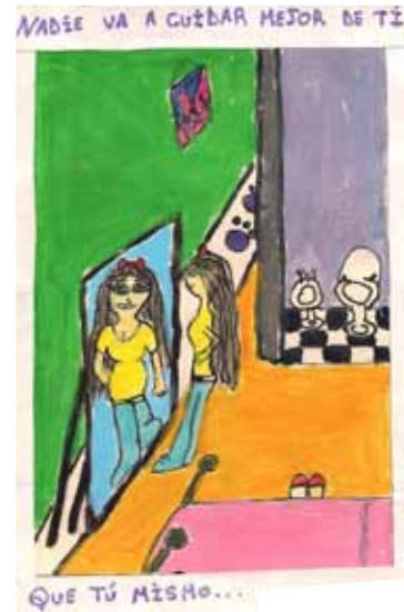
"POSTALES POR LA PAZ" REALIZADAS EN EL CENTRO COMUNITARIO LIBREMENTE (PREA DEL HOSPITAL ESTEVES, TEMPERLEY).

Para continuar con el ejemplo de Carlos, veamos la decisión que toma su hermana Juana, basándose en el respeto al derecho de todas las personas a ejercer su capacidad jurídica: Juana habla con Carlos sobre sus preguntas y dudas. Piensan cómo llevar adelante su propio negocio y administrar los bienes. Establecen, también, la forma de enfrentar una nueva situación de crisis, en caso de que se produzca. Toman en cuenta las preferencias y la voluntad de Carlos, quién decide en base a lo que considera mejor, aún a riesgo de equivocarse, Asumir el riesgo de tomar las propias decisiones es inherente a la dignidad humana.