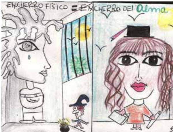
"POSTALES POR LA PAZ" REALIZADAS EN EL CENTRO COMUNITARIO LIBREMENTE (PREA DEL HOSPITAL ESTEVES, TEMPERLEY.)