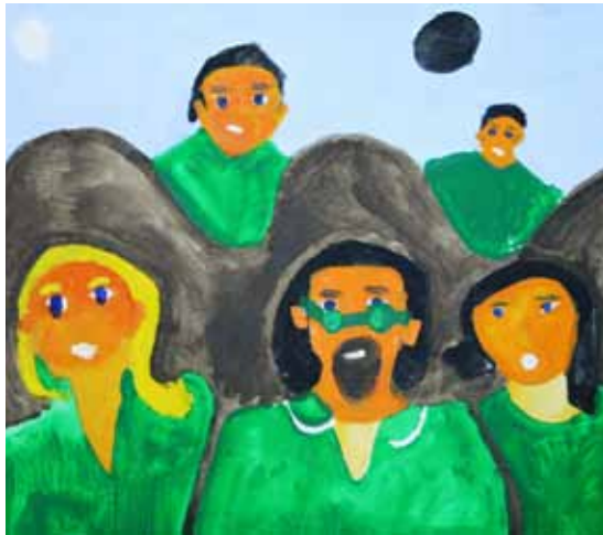
EVERBELTRÁN, PINTURA ELABORADA EN EL MARCO DE LOS TALLERES DEL FRENTE DE ARTISTAS DEL BORDA