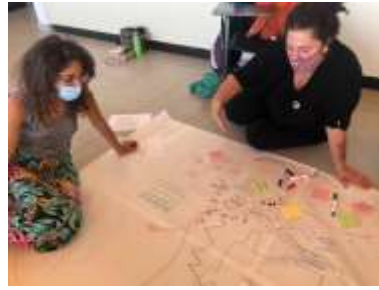
Talleres Praxis localidad Puerto Madryn