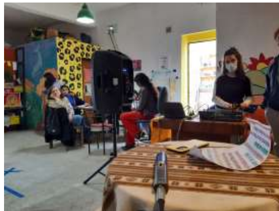
Talleres Praxis en la localidad de Trelew