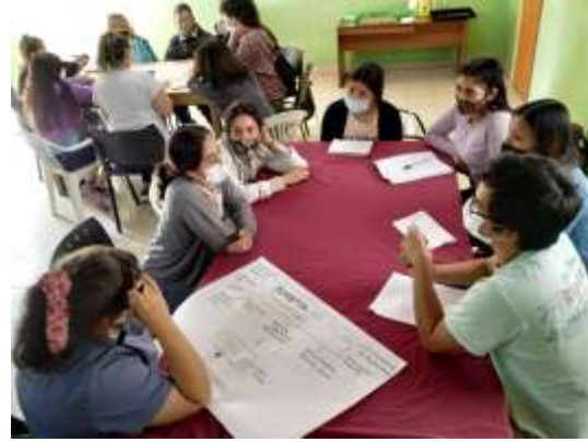
Talleres Praxis en la localidad de Esquel