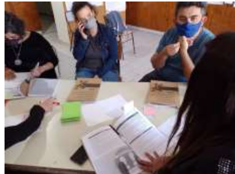
Talleres Praxis en la localidad de Rawson