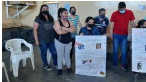
Talleres Praxis en la localidad de Comodoro Rivadavia